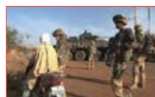
Mon pays est en guerre.